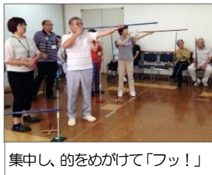
集中し、的をめがけて「フッ！」

2回連続の体験講座には、定員15名を超える応募があり、抽選をしたとのこと。熱気あふれる2回目の講座に伺いました。すでに1回目で基本的な姿勢や吹き方などを教わった受講者の皆さん。今日は前回の復習をしつつ、どんどん実践していきます。