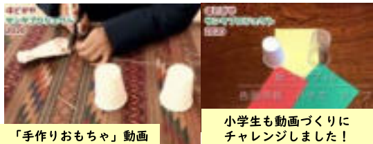
「手作りおもちゃ」動画

保土ヶ谷小学校の「遊びグループ」さんと一緒に「紙コップの手作りおもちゃ」を作って遊ぶ動画を参加しました。どんな遊びができれば楽しくなるか、やってみながら一生懸命知恵を絞り、わずかな準備期間でアイデア沢山の動画になったと思います。コロナだからおうちで楽しく遊んで欲しい、保土ヶ谷区の子供達に元気になってもらいたいとの想いが溢れた活動でした。