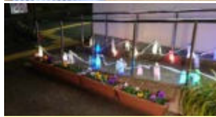
アワーズの玄関が明るく照らされました!