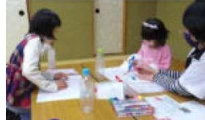
絵とLEDライトを入れてランタンづくり