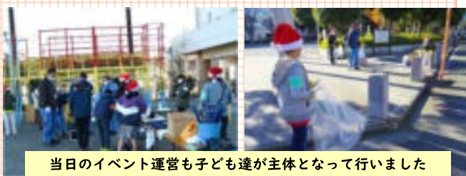
当日のイベント運営も子ども達が主体となって行いました

チームに分かれてごみを拾った量を競うという内容で、優勝チームには企業から協賛いただいた景品をプレゼント。ゲーム感覚で楽しく清掃をすることができ、結果として1日で9キロものごみが集まりました。