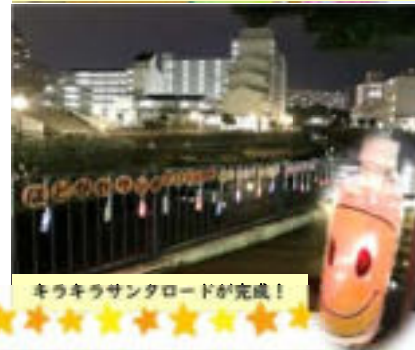
キラキラサンタロードが完成!